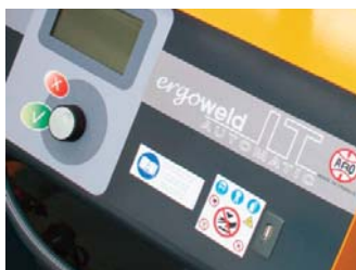
Kit USB de série pour traçabilité et chargement de programmes