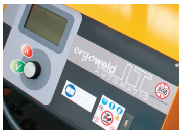
Kit USB de série pour traçabilité et chargement de programmes