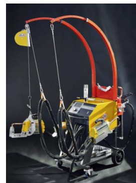
Nouveaux postes à souder Ergoweld 12K et 14 K